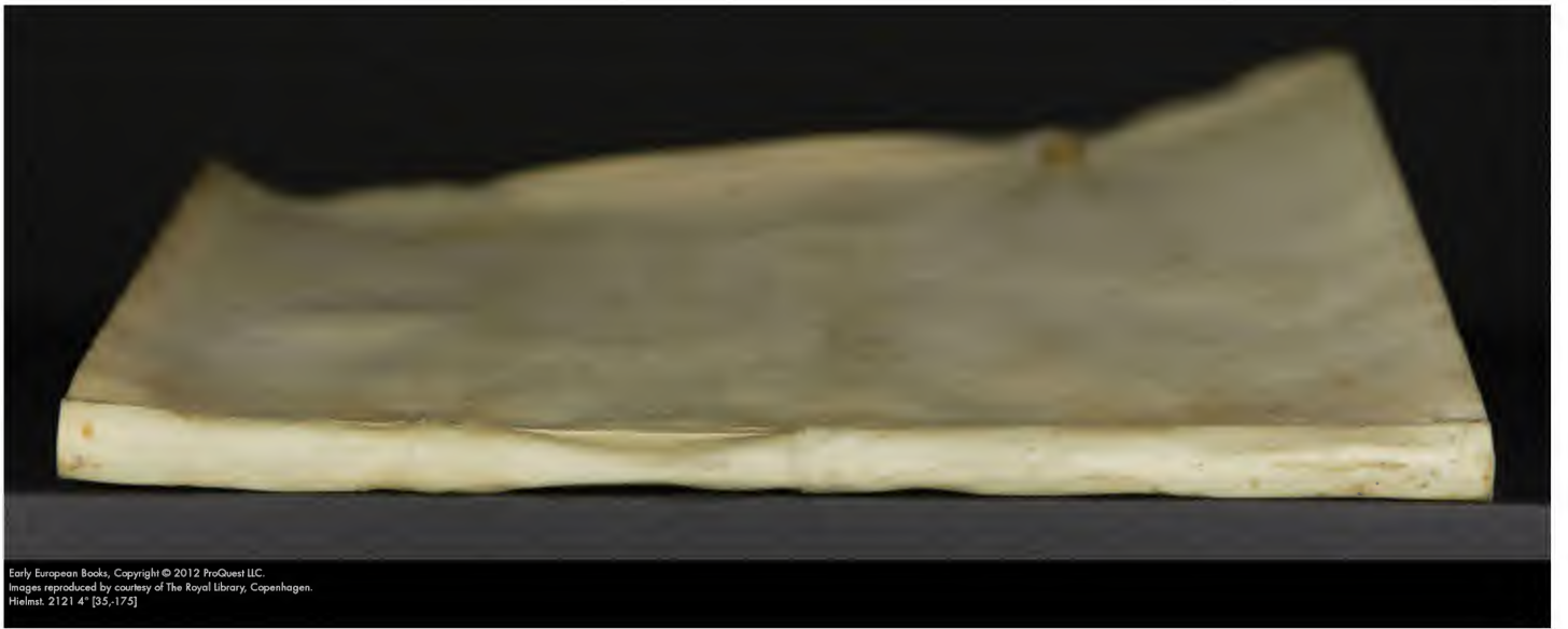
Early European Books, Copyright © 2012 ProQuest LLC. Images reproduced by courtesy of The Royal Library, Copenhagen. Hielmst. 2121 4* [35-175]